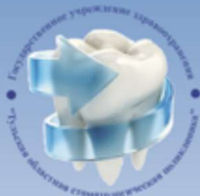
ГУЗ "Тульская областная стоматологическая поликлиника"